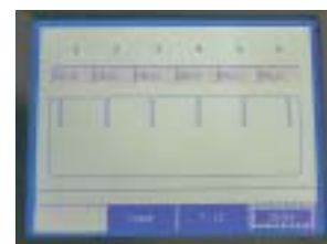
Simatic Panel (Touchscreen)